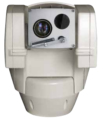
ULISSE COMPACT THERMAL

Die integrierte Tag-/Nacht Kamera von SONY, mit mehreren optischen Zooms (36fach, 18fach oder 10fach), ermöglicht nah- und fernegelegene Objekte gleichermaßen mit einer außergewöhnlichen Genauigkeit aufzunehmen und die Privatzenen dynamisch zu maskieren.