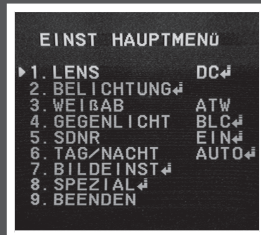
OSD-MENÜ und Video-Testausgang