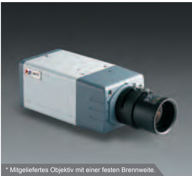
* Mitgeliefertes Objektiv mit einer festen Brennweite.